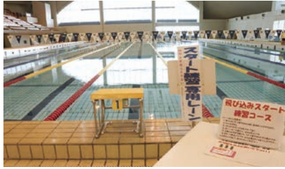
飛込みスタート練習レーン

初回講習を受けた方であればトレーニングルームをご利用頂けます。30種類以上のマシンで思う存分汗を流してください。