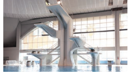
ダイビングプール

水は50m先まで見渡せるほど綺麗です。のんびりコースもあるので水泳初心者でも安心して泳げます。