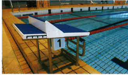
ダイビングプール

水は50m先まで見渡せるほど綺麗です。のんびりコースもあるのでゆっくり安心して泳げます。